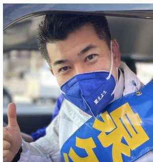
泉 健太 (いずみ けんた)

1974年生まれ。47歳。立命館大法学部卒。 25歳の時に地盤・看板・鞆ナシで国政出馬。 29歳で初当選 以来、衆議院当選8回、京都3区。 立憲民主党 政務調査会長。 家族5人とうさぎ1羽。趣味はDIY・料理・自転車。